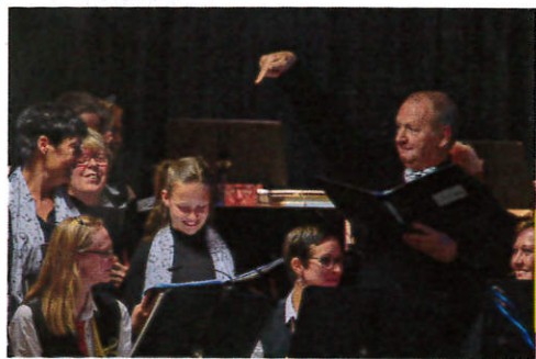
Concert du 1er Mai de l'Harmonie Fanfare L'Avenir avec la participation d'Alcy Chante