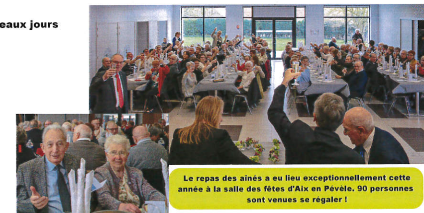
Le repas des aînés a eu lieu exceptionnellement cette année à la salle des fêtes d'Aix en Pévèle. 90 personnes sont venues se régaler !