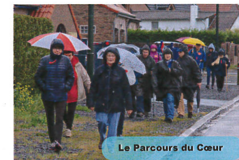
Le Parcours du Cœur