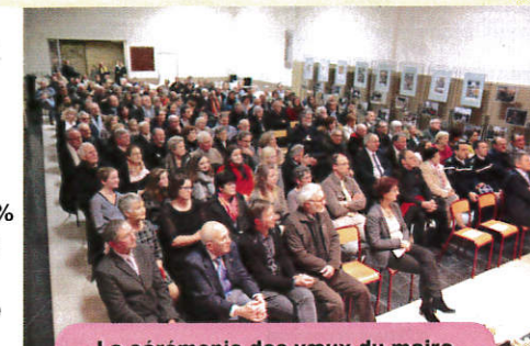
La cérémonie des vœux du maire