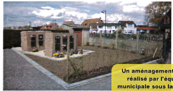
Un aménagement d'espaces verts réalisé par l'équipe technique municipale sous la direction de Jean Marie Thibaut

La salle des fêtes fait l'objet d'une rénovation complète (isolation thermique et acoustique) et d'une extension. Les sanitaires seront entièrement refaits pour être aux normes pour l'accessibilité aux personnes à mobilité réduite. La cuisine sera agrandie et réaménagée afin d'offrir plus de fonctionnalités et d'espace. La scène a été démontée. En cas de besoin des praticables pourront être installés