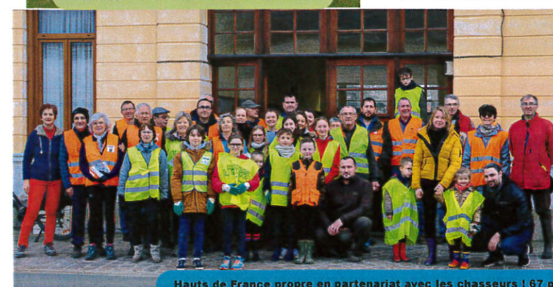
Hauts de France propre en partenariat avec les chasseurs ! 67 participants, dont 23 enfants 750 kg de déchets ramassés et tout le village a pu être nettoyé grâce à l'importante mobilisation Grand Merci à tous les participants !