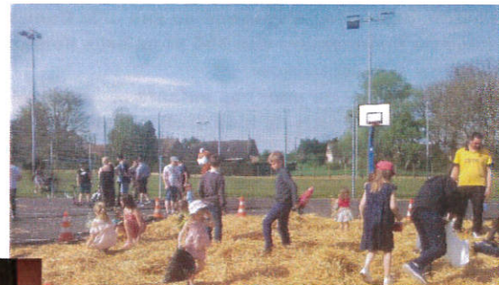
La Chasse aux Œufs !