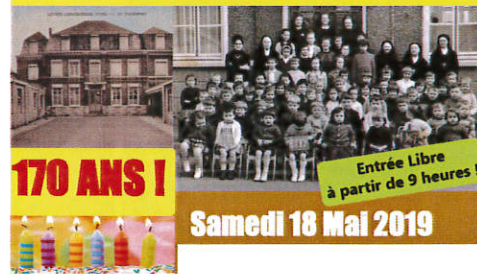
170 ANS ! Entrée Libre à partir de 9 heures ! Samedi 18 Mai 2019

JUIN : - Samedi 1er : Fête du Sourire – Foot – AJA - Mercredi 12 : Relais Assistante Maternelle - Samedi 15 : Gala de danse Evi Danza à la salle des sports d'Aix lez Orchies Présentation du programme ALSH 10h à l'école Fleuri d'Alcy - Mardi 18 : Commémoration du 18 Juin - Vendredi 21 : Fête de la musique sur le parking médiathèque - Samedi 22 : Kermesse de l'école du Fleuri d'Alcy - Mercredi 26 : Relais Assistante Maternelle - Dimanche 30 : Kermesse de l'école du Sacré-Coeur